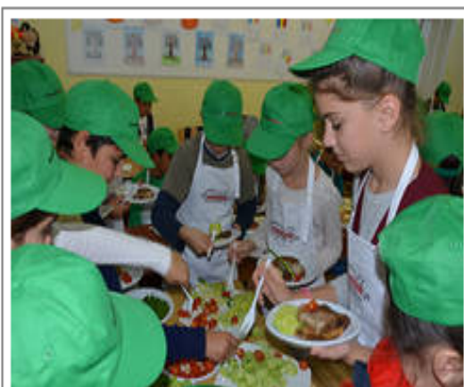
Ziua de Vest

Cu ocazia Zilei Internationale a Alimentatiei, Smithfield Romania a organizat, pentru al doilea an consecutiv, in colaborare cu Scoala cu clasele I-VIII din localitatea timiseana Utvin, o lectie - experiment pentru constientizarea importantei unei alimentatii echilibrate si incurajarea adoptarii unui stil de viata sanatos, inca de la cele mai fragede varste. Protagonistii atelierului au fost 30 de elevi din clasele a III-a si a IV-a care au participat cu mult entuziasm atat la partea teoretica ... citeste toata stirea