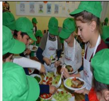
Elevii din localitatea Utvin au învățat despre rolul unei alimentații echilibrate pentru o dezvoltare sănătoasă