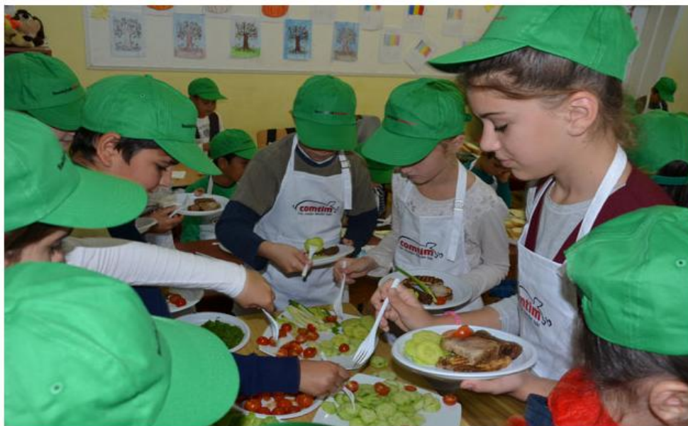
De Ziua Internationala a Alimentatiei, Elevii din localitatea Utvin au invatat despre rolul unei alimentatii echilibrate pentru o dezvoltare sanatoasa